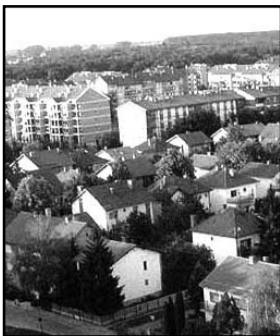
Грађани улица Нушићева, Фрушкोगорска и ЈНА