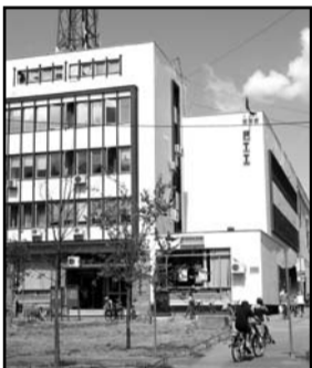
Dušan Bajić, kontrolor dostave u Pošti Sombor

- U tom reonu u decembru je počeo da radi novi poštar, pa su računi isporučeni do 19. decembra. Bilo je kašnjenja u isporuci pošiljki, ali za to postoji nekoliko razloga. Taj reon je izuzetno težak i ima veliki broj raznih pisama, jer se tu nalazi veliki broj advokatskih kancelarija, ali i građana. Kada poštar nekoga ne nađe u stanu, kući ili kancelariji, za svaku preporučenu pošiljku mora da ispiše obaveštenje, što oduzima mnogo vremena. Pošta na isporuku dolazi dva puta dnevno, lokalna ujutro, a iz drugih mesta tokom prepodneva, tako da ona na red za isporuku stiže tek sledećeg dana. Pored toga, pošiljke iz drugih poštanskih centara stižu sa zakašnjenjem, a mi na to u Somboru ne možemo da utičemo. Što se tiče reona kojem pripadaju Nušićeva, Fruškogorska i ulica JNA, tražili smo da se na neki način rastereti, da se podeli sa susednim poštarima ili da nam se odobri angažovanje još jednog, ali odluka o tome opet ne zavisi od nas. Nadam se da već u januaru neće biti navedenih problema, jer će se do tada novi poštar upoznati sa terenom koji mu je dodeljen.