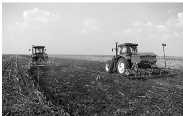
Ко је „бацио око“ на земљу бивших власника?

Имамо искуство приликом враћања земљишта деведесетих година када је