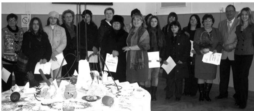
Полазницима обуке додељени сертификати

PRIVREDNA KOMORA SRBIJE DODELILA PRIZNANJA USPEŠNIM PREDUZEĆIMA I POJEDINCIMA