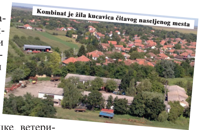
Kombinat je žila kucavica čitavog naseljenog mesta

Од 1. јануара 2013. године у Алекси Шантићу почиње с радом најсавременија кланица свиња која ће испуњавати