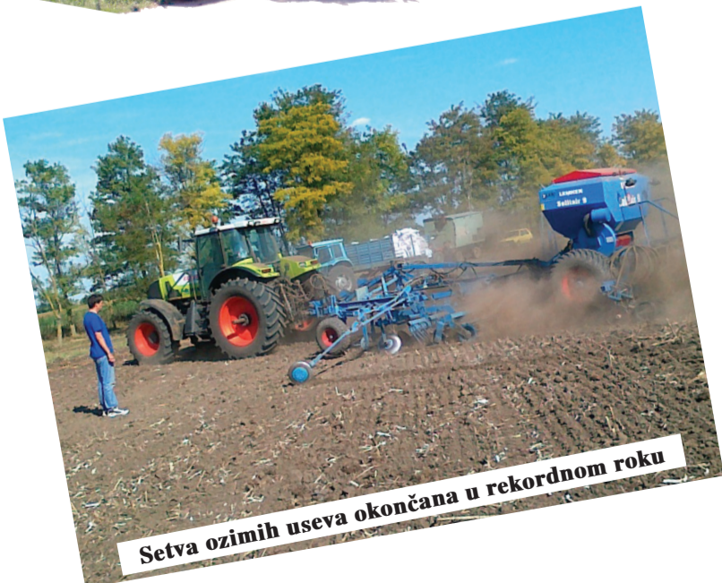
Setva ozimih useva okončana u rekordnom roku