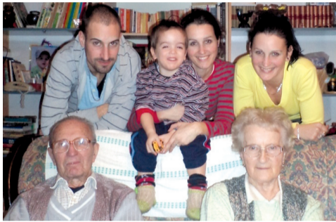
Данас у кругу вољених унука и праунака