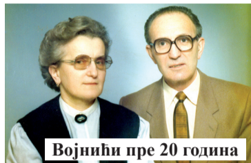
Војнићи пре 20 година

Роково фудбалско ангажовање. Боје сомборског „Радничког“ бранио је у „златним годинама“ овог клуба, а у заслужену пензију отишао је као матичар, који је у Сом-