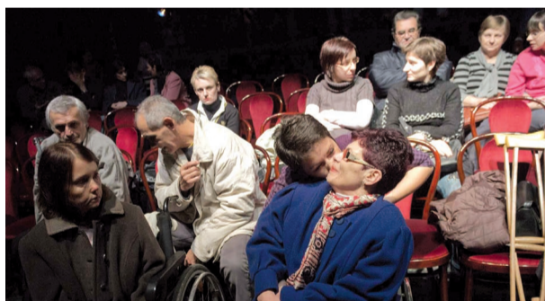
малој сцени Студија 99 (на одиграна на великој сцени спрату), прилагођена је и (у приземљу).