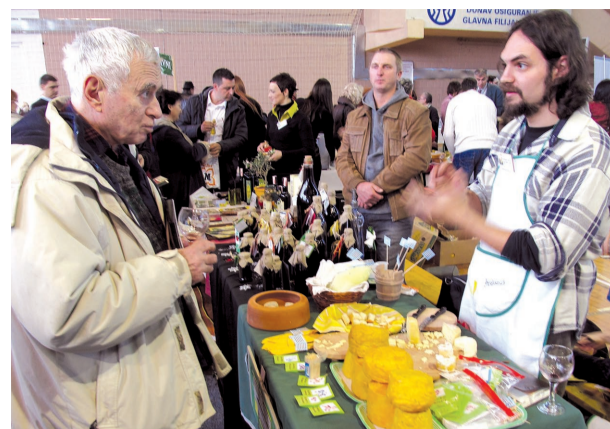
"Aristaeus cheese" Bački Monoštor

ju gastronomsku ponudu predstavilo oko 20 izlagača hrane i specijaliteta sa ovog područja. Promovisani su "Udruženje maslinara iz Slovenije" i manifestaci-