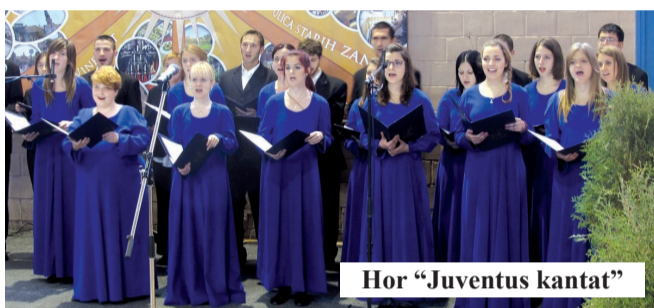
Hor "Juventus kantat"