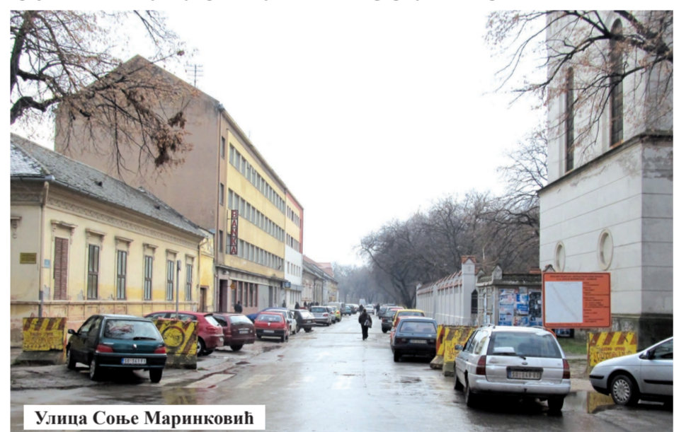
Улица Соње Маринковић