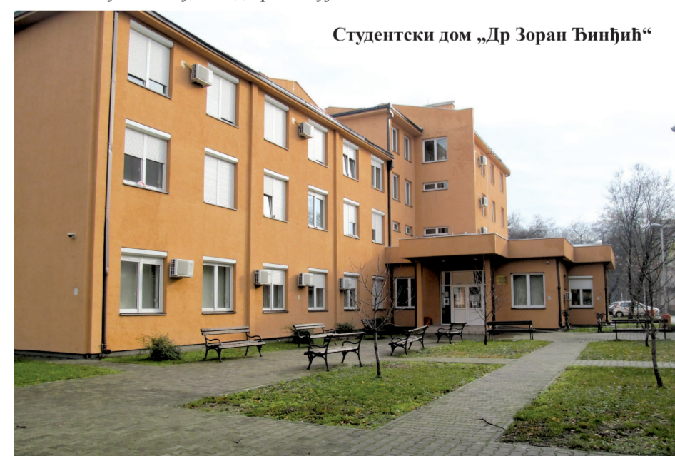
Студентски дом „Др Зоран Ђинђић“

Фонд ће реализацију ових средстава вршити након извршеног плаћања од стране града у складу са приливом средстава из буџета АПВ. Треба напоменути да су и остали градови и општине у Војводини закључиле овакве протоколе