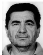
МИЋИ АЛЕКСИЋУ ГУБИ