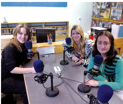
Snimanje radio emisije