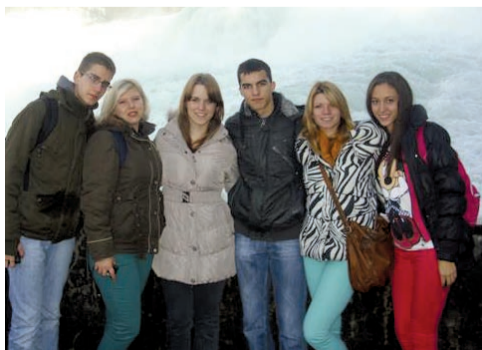
Izlet na vodopade Rajne