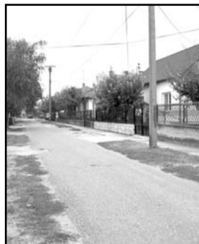
Грађани улице Isidore Sekulić

- У салашком насељу Bilić godinama постоји локал у центру насеља, који је у власништву МЗ „Crvenka“ и који ова месна заједница издаје у закуп на коришћење заинтересованим лицима. Међутим, последњих 5 година локал је у закупу власника који угоститељску делатност обавља „на црно“, па ме занима како месна заједница може да изда локал закупцу који ради илегално?