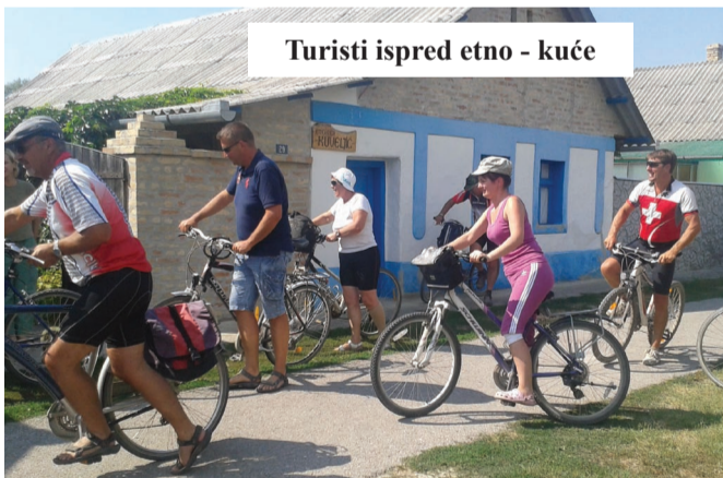
Turisti ispred etno - kuće

Tako je i minulog vikenda, u Monoštor stigla grupa slovenačkih kampera, i to biciklima, zbog blizine i naravno uz put, prirode koja je neopisivo lepa. Zanima-