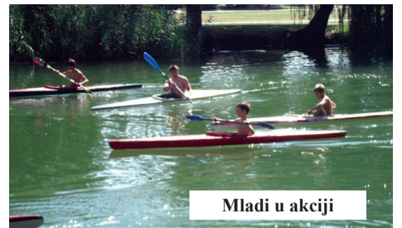
Mladi u akciji

U KK „Dunav“ Bezdan polažu velike nade u polaznike ove škole koja i dalje treba da nastavi tradiciju i da go-