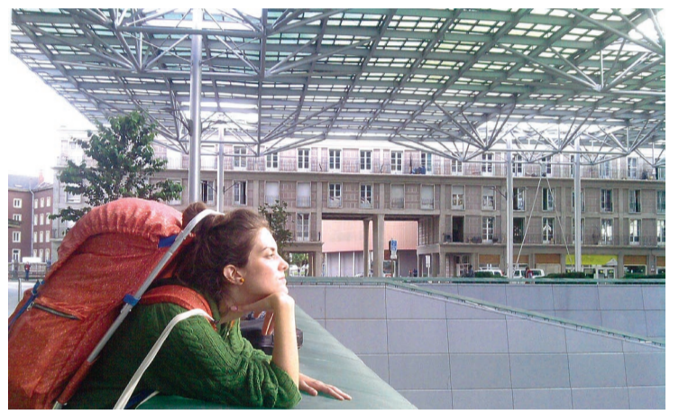
Sofija u Parizu

preduzeća, ali jedino preduzeće koje im je izašlo u susret je „Zapadna Bačka“.