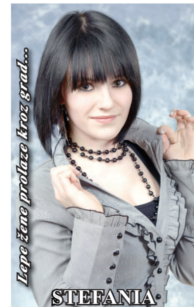
Lepe žene prolaze kroz grad...

„Дубрава“ је једина већа послатичарница у граду. И у летњим и у зимским месецима она је препуна гостију, али је локал искупише мали. Како смо обавештени, продавница „7. април“ се ускоро сели, па би најбоље било да се и просторије овог локала прикључе „Дубрави“, тим пре што су се оне већ налазиле у њеном саставу. Колектив ове послатичарнице располаже финансијским средствима за потребне радове око адаптације и с те стране нема никаквих проблема.