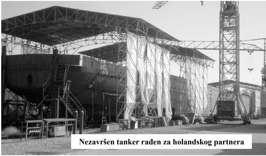
Nezavršen tanker raden za holandskog partnera