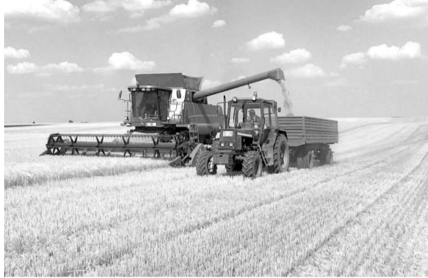
Obnovljena mehanizacija na njivama „Aleksa Šantića“

Žetva je uspešno okončana a prinosi su zadovoljavajući s obzirom na sušu koja nas je ove godine zadesila. S.M.