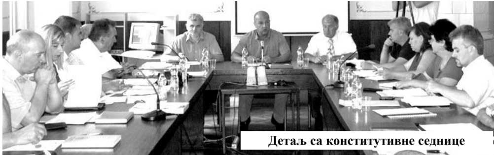
Детаљ са конститутивне седнице

Градско веће утврђује Предлог одлуке о буџету града, врши надзор над радом Градске управе, поништава