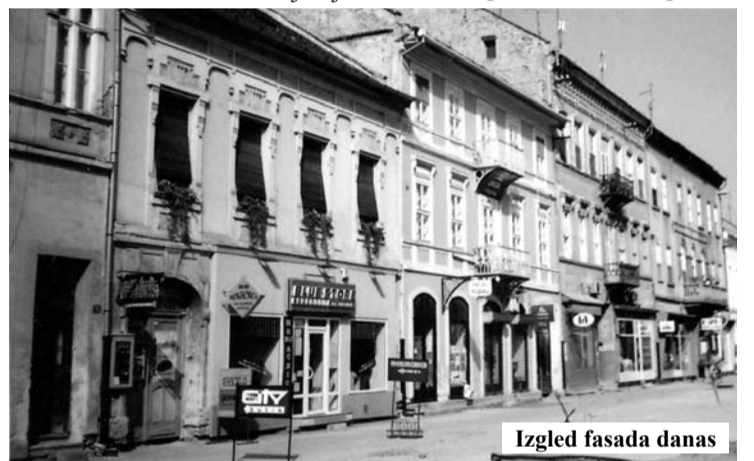
Izgled fasada danas

skih razlika krovnih venaca veće i kalkanske površine, koje su zanemarene kod obnove. To se najbolje vidi kod zdanja Gradske biblioteke „Karlo Bijelicki“, čija je ulična fasada obnovljena pre nekoliko godina i susednog znat-