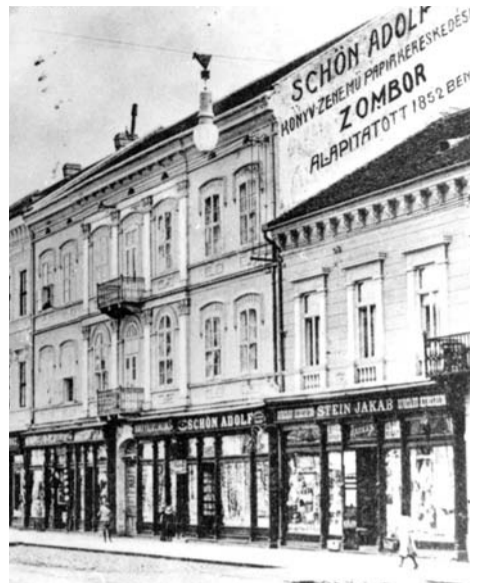
Reklama pre sto godina na kalkanskom zidu

Uklanjanje platana i starih bođoša u Ulici Kralja Petra I prilikom rekonstrukcije u pešačku ulicu, ima i jednu dobru stranu. Bar privremeno otkrivena je riznica stare arhitekture i njene vrednosti koju nismo mogli zbog bujnosti i visine krošnji u celosti sagledati. To je velika graditeljska baština kojom se Somborci ponose. Još nam se oči nisu navikle na skladnost i harmoniju ovih zdanja, kao i na dubinu perspektive ulice koja nam otkriva dimenziju i lepotu urbanog prostora jezgra grada. Fasade ovih zgrada su svedočanstvo jedne epohe, kada je njen izgled bio simbol ukusa i materijalnog statusa domaćina, kao i odraz ličnosti koji su u njoj živeli. Otkrivena nam je i raznovrsnost istorijskih stilova, toplina kolorita i visinska dinamika krovova. Videli smo u kakvom su stanju nje-