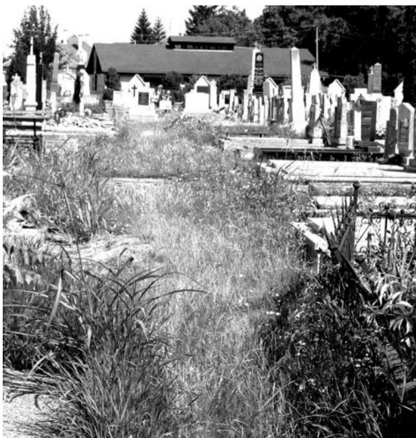
Велико католичко гробље