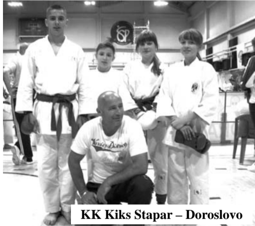
KK Kiks Stapar - Doroslovo