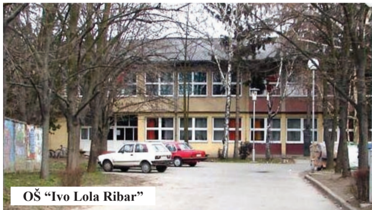
OŠ "Ivo Lola Ribar"

- Zvaničan dopis o tome da se proslava male mature mora održati u školama stigao je 8. maja, a odeljenske starešine i roditelji osmaka dogovorili su se o tome pre zvaničnog dopisa na opštem roditeljskom sastanku koji je održan 20.