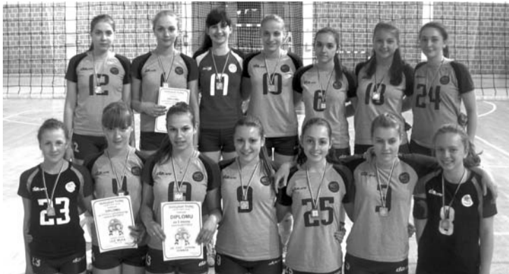
Juniorke OK CVS

Ono na čemu treba da poradi Odbojkaški Savez Srbije, smatra Relić, je zaštita manjih sredina i matičnih klubova od preranog odlaska perspektivnih igračica u druge sredine, a pogotovo bez dinara obeštećenja, jer se na tim igračici gradila igra bar dok one ne navršše 18 godina i ne postanu punoletne, kada ima pravo da potpiše profesionalni ugovor. Taj problem je Košarkaški savez rešio, a odbojkaški klubovi iz manjih sredina se nadaju da će ga i Odbojkaški