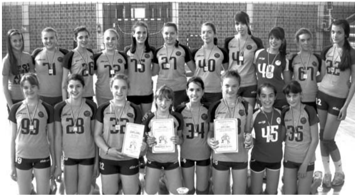
Pionirke OK CVS