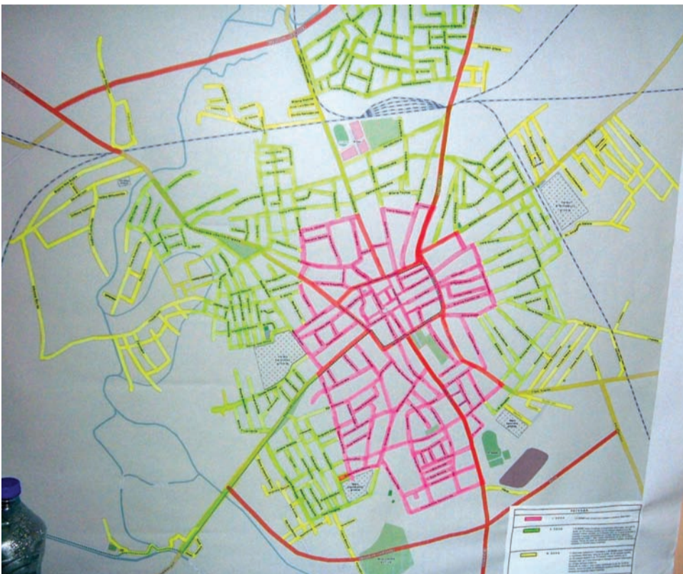
Мапа Сомбора са поделом на зоне држања животиња