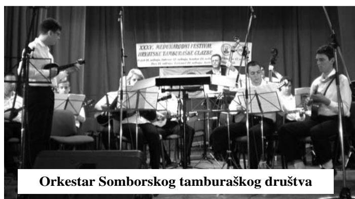
Orkestar Somborskog tamburaškog društva