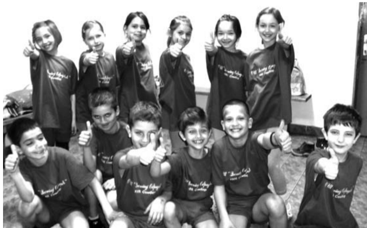
Učenici OŠ "Dositej Obradović" Sombor