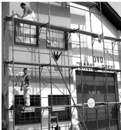
Pripreme za proslavu stogodišnjice DVD-a

za dalji rad ovog društva. Meštani mogu biti ponosni na svoje vatrogasce koje karakteriše velika angažovanost i spremnost da pomognu u bilo koje doba. Ono što se ne sme zaboraviti i što predstavlja najveći ponos ovog društva, su uspeši devojaka 1996. godine kada su postale prvaci države. Treće mesto u kategoriji CTIF osvojile su u Danskoj 1997. godine, a prvaci Evrope postale su 1998. godine na takmičenju u Nemačkoj. Još jednom svaka čast devojkama, a u Društvu se nadaju da bi "mlade nade" Bačkog Brega mogle ponoviti ovaj fantastičan uspeh. J. Kovačev