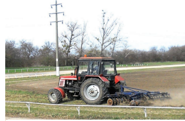
Трактором је изравнан средишњи део хиподрома