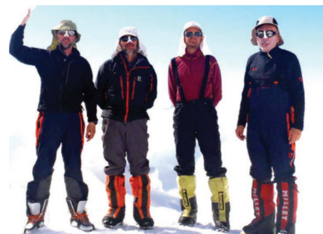
Експедиција Denali 2011