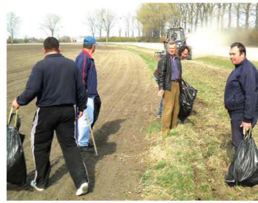
Вреће пуне смећа