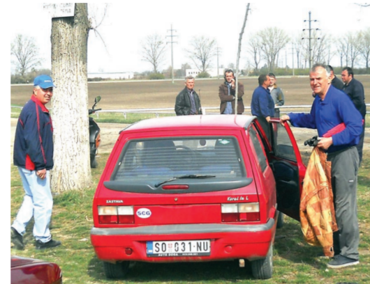
Почетак акције чишћења