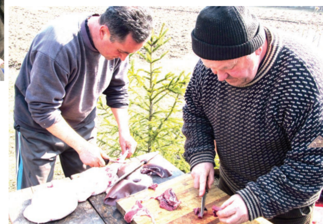
Seckanje slanine za čvarke