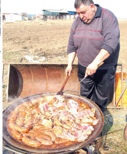
Cveja je bio zadužen za tanjiraču