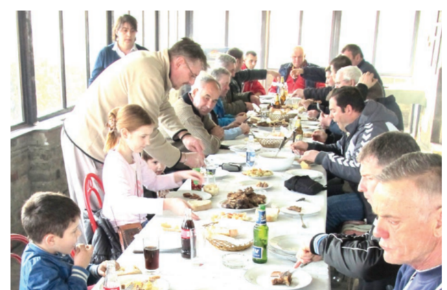
Bogata trpeza u "Bunkeru"