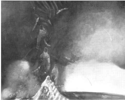
Зоран Стошић Врањски: Космичка пансодија, 2008.

планетарни обриси су ту, ту је и карактеристичан колористички склоп са изгледом „испраног“ музејског тона а широког валер-