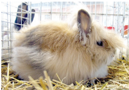
Lavlja glava – egzotika sajma