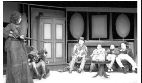
Scena iz predstave Sestre Karamazove