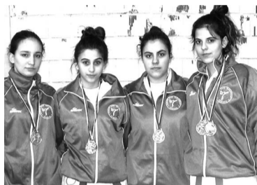
Juniorke „Ravangrada“ viceprvakinje Vojvodine u sportskoj borbi