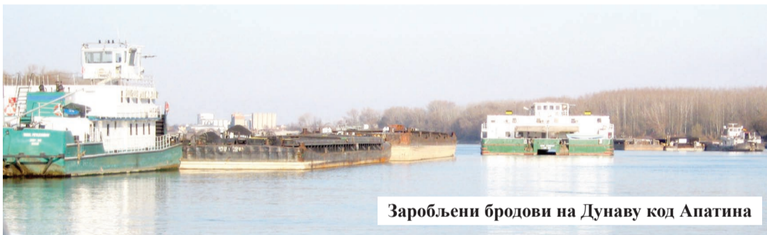
Заробљени бродови на Дунаву код Апатина

Бродови и барже који су присилно укотвљени не представљају опасност по речни саобраћај, јер се сви налазе ван пловног пута.