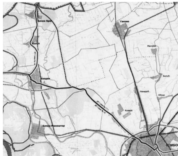
Trasa puta od Sombora do Bačkog Brega

grada Sombora iznosi ukupno 320.603 evra, od čega je 272.513 evra bespovratnih sredstava, a 48.090 je učešće grada Sombora. Sredstva koja bi Sombor mogao da dobije u nastavku realizacije ove ideje mogla bi da budu zna-