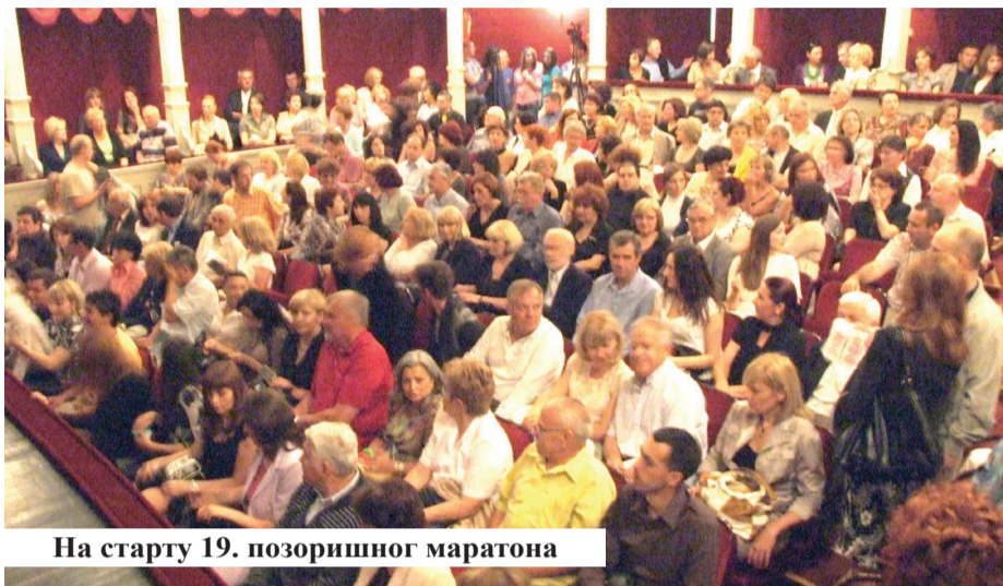
На старту 19. позоришног маратона

ведено је шест премијерних представа, од којих једна у Шведској (Опера и Музички театар у Малмеу), прослављен је 128. рођендан Позоришта, обележене су годишњице Лазе Костића, успешно је учешће на више фестивала (4 фестивала - 13 награда!).