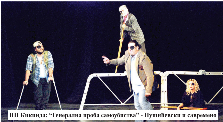
НП Кикинда: "Генерална проба самоубиства" - Нушићевски и савремено