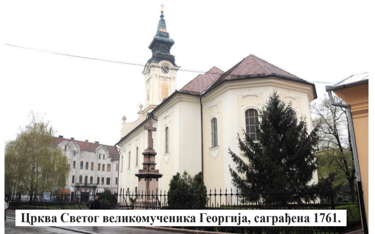
Црква Светог великомученика Георгија, саграђена 1761.