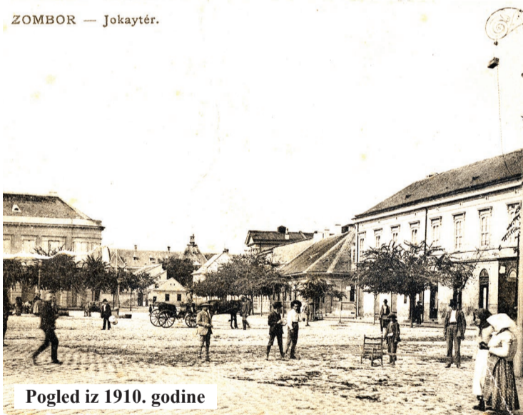
Pogled iz 1910. godine