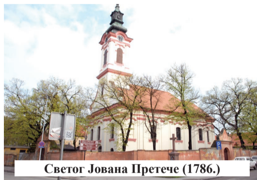
Светог Јована Претече (1786.)