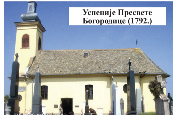
Успеније Пресвете Богородице (1792.)

ловце израстао у најважније исходиште српске духовности на просторима Аустријске царевине, односно Угарске“. Захваљујући повлашћеном статусу 1786. године постао је стално седиште Бач – бодрошке жупаније, управно и административно седиште Бачке.