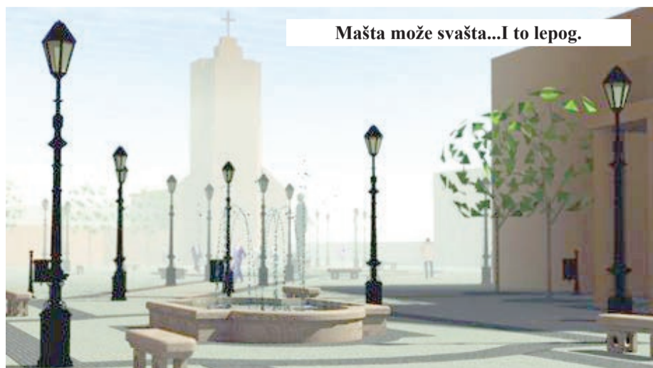
Mašta može svašta...I to lepo.

Možda zbog blizine pozorišta, ali u ovom trenutku neku buduću kulturološku funkciju trga vidim u letnoj pozornici, koju bi koristili mladi za svoje programe, služila bi od intimnih lirskih književnih susreta do nedeljne muzičke pro-