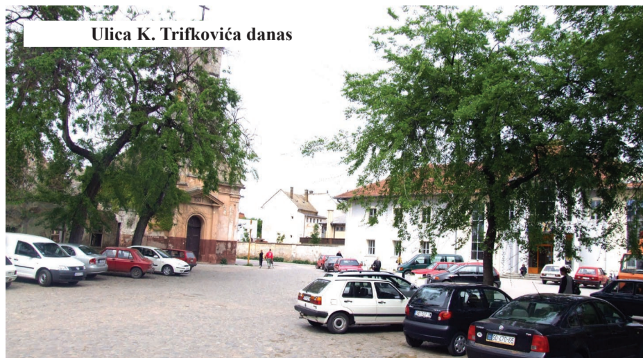
Ulica K. Trifkovića danas