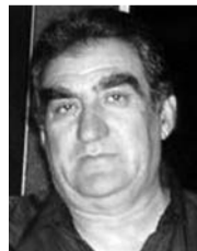
РАДИВОЈУ - РАЈКУ ПРЕРАДОВИЋУ