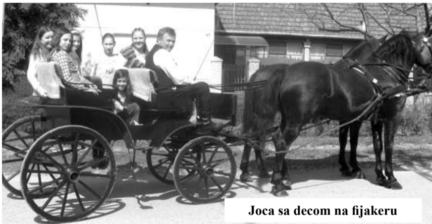
Joca sa decom na fijakeru

sudi na mnogim izložbama i pred- stavljanjima konja i fijakera, a u poslednje vreme „pozajmljuje“