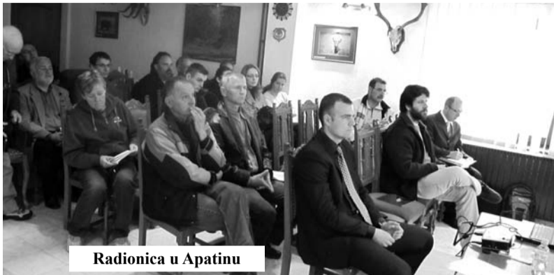
Radionica u Apatinu

Konsultantska kompanija "Biotop" i JP „Vojvodinašume“, uz pomoć kompanije "Velia Transport" organizovali su 15. aprila u Apatinu radionicu na temu upravljanja rezervatom, u sklopu priprema za izradu novog plana upravljanja za period od 2011. do 2020. U srcu rezervata, u Lovvačkoj kući "Mesarske livade", okupili su se predstavnici lokalnih zajednica, nevladinih organizacija koje deluju u Rezervatu, vodoprivrede, turističkih or-