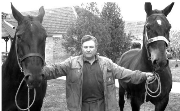
Sa svoje dve rasne kobile

lepotana, dve svoje kobile, jednogodišnje ždrebe i pastuva, s kojima paradi i obilazi „Fijakerijade“. Kao aktivista Somborskog konjičkog kluba učestvuje i