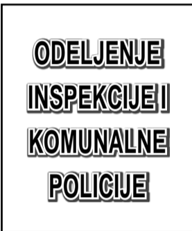
Odeljenje inspekcije i komunalne policije

- Postupak uklanjanja kioska koji se nalazi pokraj dečijeg igrališta u Ulici Milete Protića, u skladu sa važećim propisima je u toku. Vlasniku predmetnog kioska je naloženo da ukloni kiosk u zakonskom roku. U slučaju da po rešenju ne bude postupljeno, izvršiće se prinudno uklanjanje kioska.