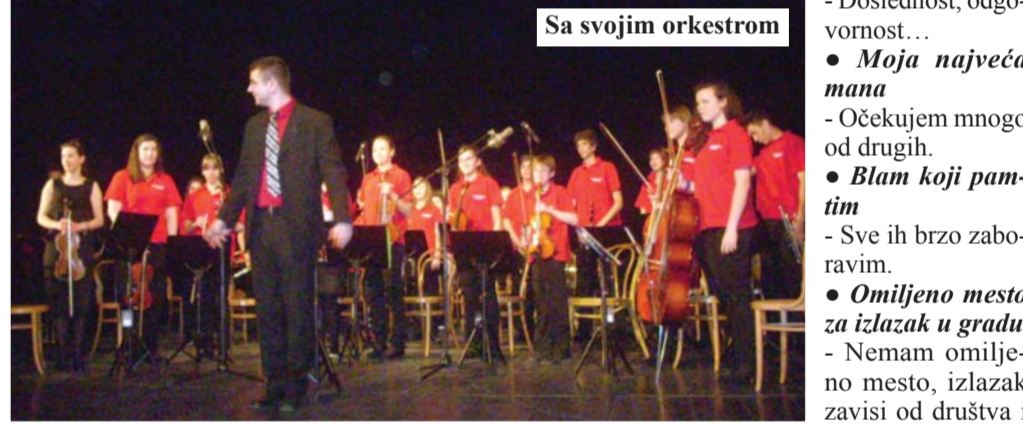
Sa svojim orkestrom