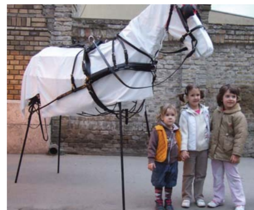
Uspomena devojčicama pred rukotvorinama starih zanata