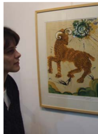
Pred Dalijevim delom