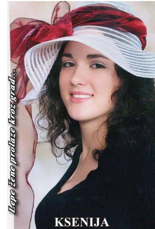
Lepo žene prolaze kroz grad...