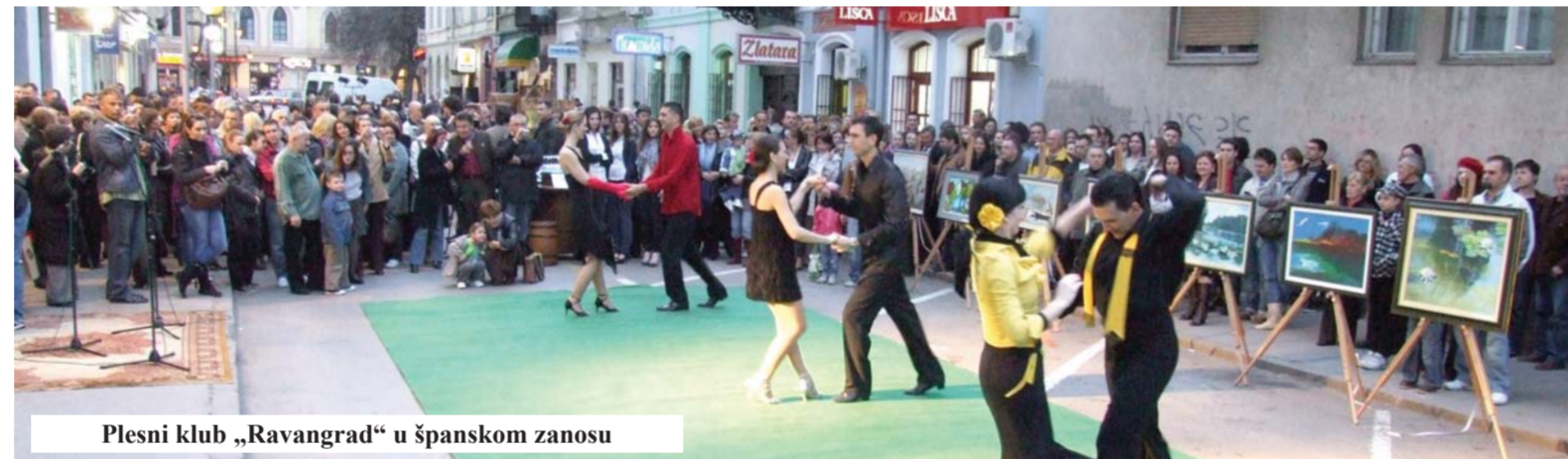
Plesni klub „Ravangrad“ u španskom zanosu