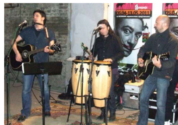
„Branimir i neprijatelji“ Novi Sad