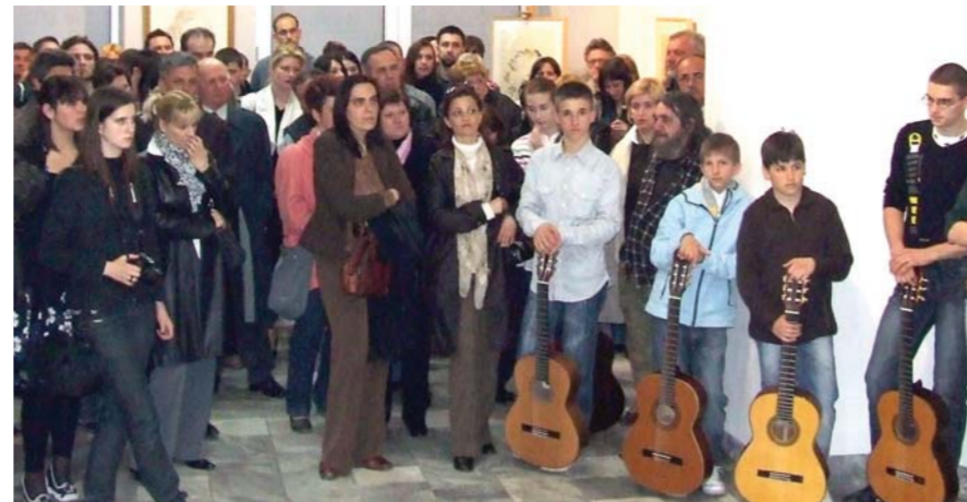
Baš u prvom redu – gitaristi Somborske muzičke škole