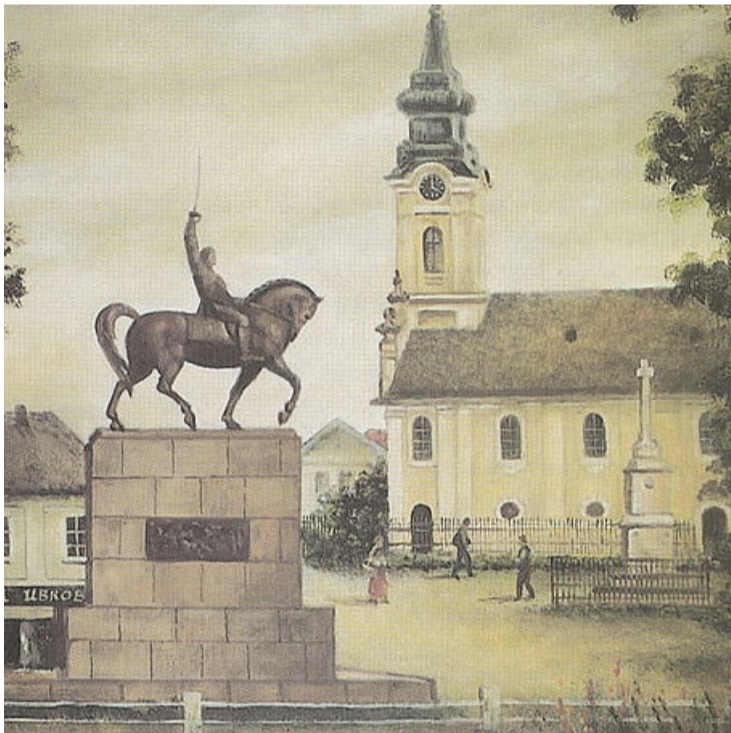
Овде је био и овако је изгледао споменик краљу 1940. године (Слика Саве Стојкова)