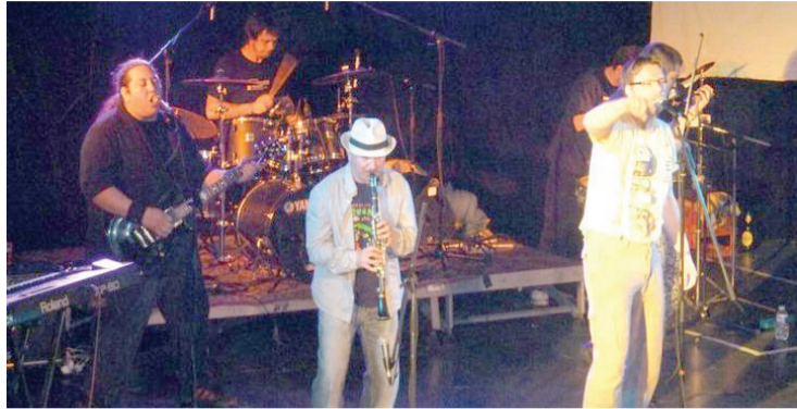
Sa nastupa u Strazburu

Oduševili su publiku u Parizu, Strazburu, Cirihi i Lucernu! Sudeći po pozivima koji svakodnevno stižu, sledeće destinacije „Neozbiljnih pesimista“ verovatno će biti Vintertur, Bazel, Beč, neki gradovi u Skandinaviji i mnogi drugi