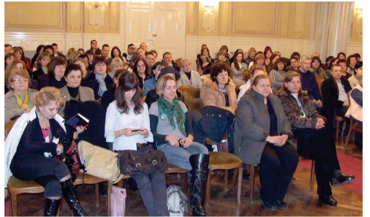
Prepuna sala Gradske kuće

ODRŽANO PRVO DRUŽENJE TVITERAŠA I BLOGERA U SOMBORU