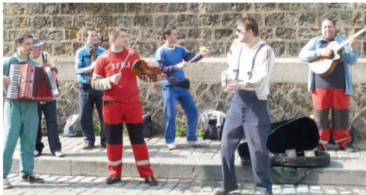
Snimanje spota u Parizu

ODRŽANO PRVO DRUŽENJE TVITERAŠA I BLOGERA U SOMBORU