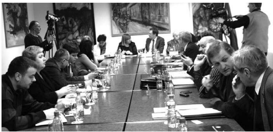
Са састанка у Регионалној привредној комори у Сомбору