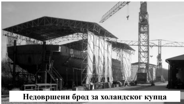
Недовршени брод за холандског купца