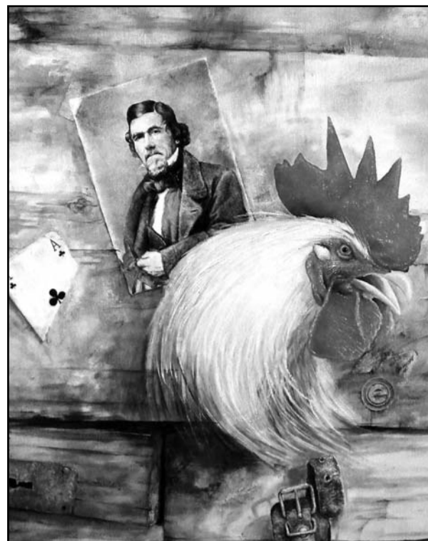
Слика сомборског уметника Саше Ловренова