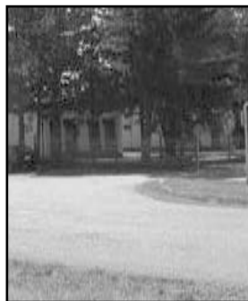
Grupa radnika "Zadrugarke"

- Zašto nadležni ne kažnjavaju vlasnike pasa koji svoje ljubimce puštaju bez povoca i korpe kada ih vode u šetnju (u centru grada, u parku, na stazi kraj kanala)? Često se dešava da psi napadaju prolaznike ili skaču na šetače, plaše decu i jure bicikliste.