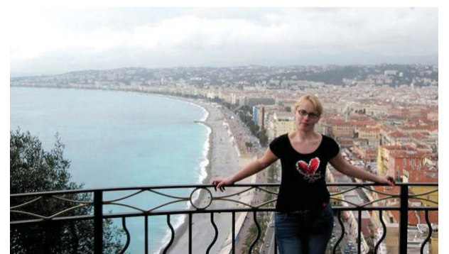
Из скијашке опреме у кратке рукаве