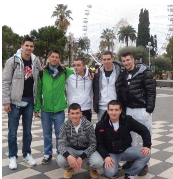
Сомборци у Ници

Мало је производа који коштају испод два евра. На пример, за кока-колу у угоститељским објектима треба издвојити најмање 3 евра, а ако желите нешто и да поједете, најмање је