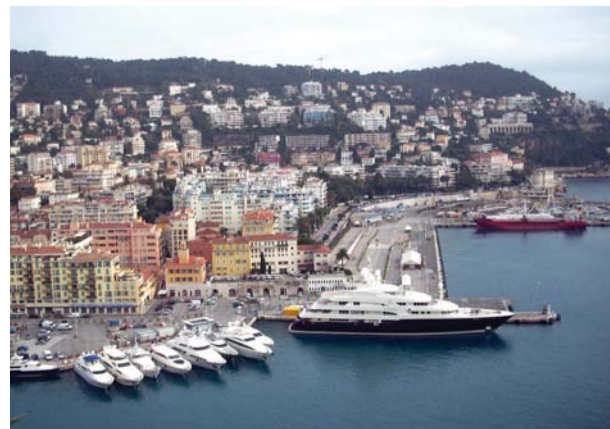
Величанствен поглед на Азурној обали