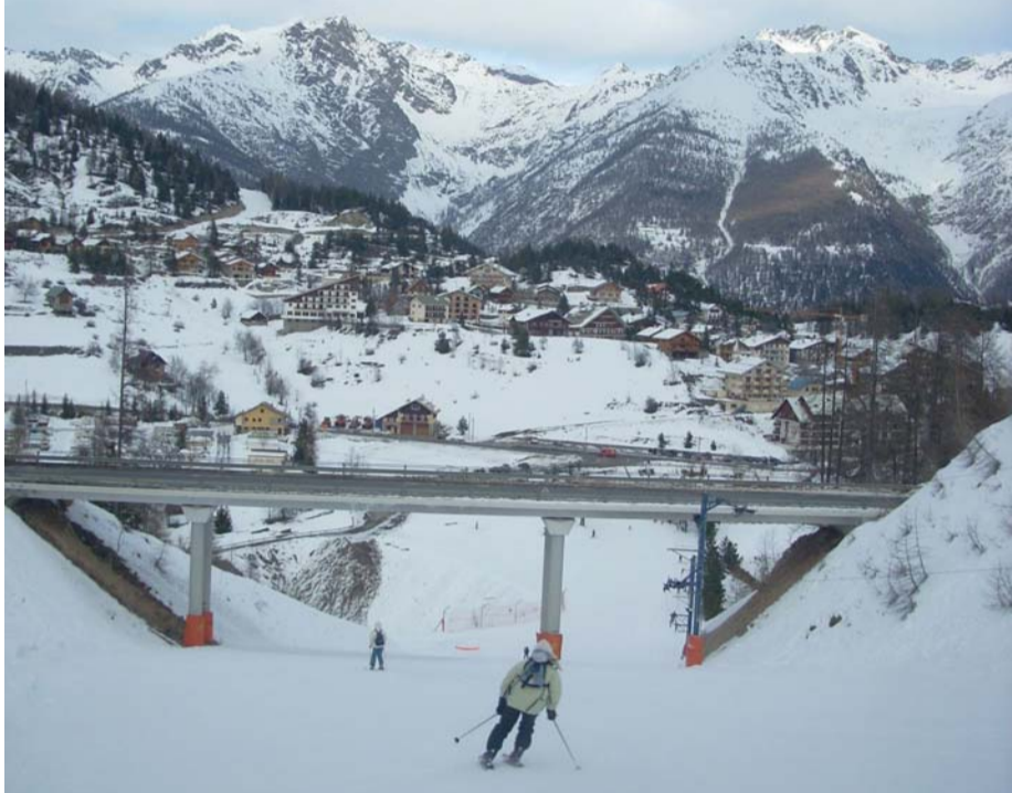
Једна од 43 скијашке стазе

Фебруар и почетак марта су шпиц скијашке сезоне у Француској, када