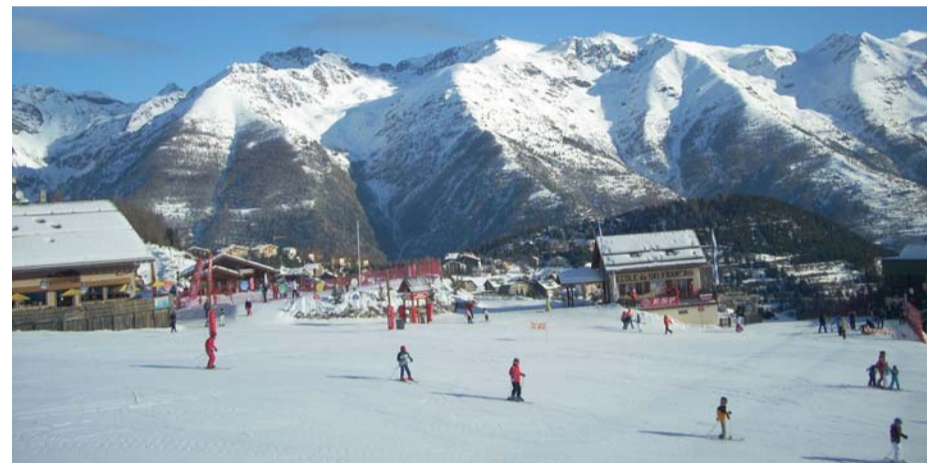
Рај за све генерације