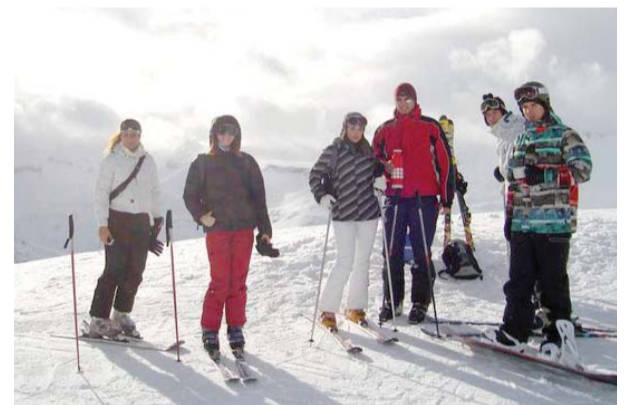
Скијашки и бордери на снегу