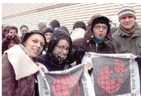
SEC crew kao podrška JAZAS - u u Bugarskoj

Ako se ima u vidu da je pri kraju projekat obuke omladinskih lidera Sombora „ Da se upoznamo, zovem se omladinski rad “, a uveliko razvijen besplatan dečji servis kroz socijalno - humanitarni projekat „ Škola dobre volje – volonter u službi deteta “ u sklopu kojeg volonteri na poziv roditelja pomažu deci u učenju i s njima kreativno provode slobodno vreme, s pravom se može reći da je „Somborski edukativni centar“ danas najaktivnija organizacija koja se bavi poboljšanjem položaja dece i mladih u Somboru i šire.