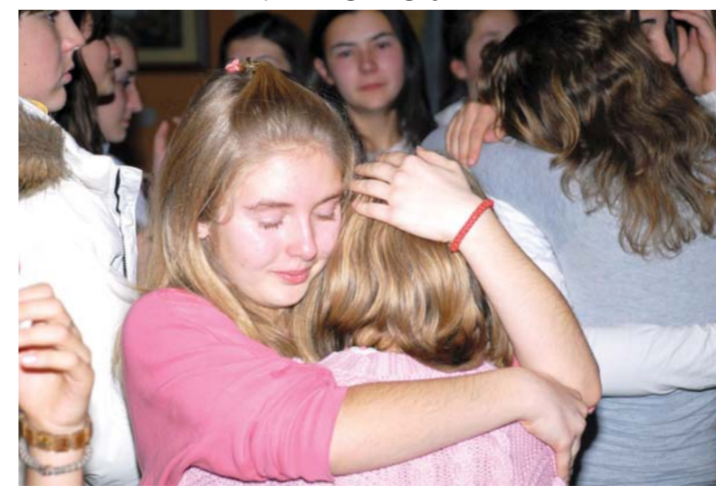
Сузе на орoштају