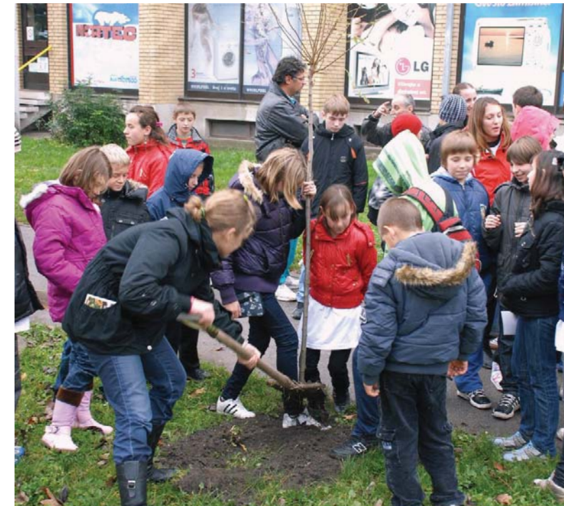
Посађено и дрво пријатељства