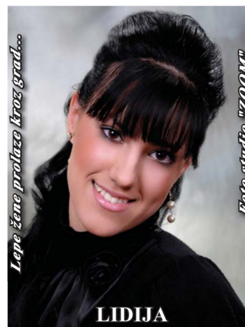
Lepo žene prolaze kroz grad...