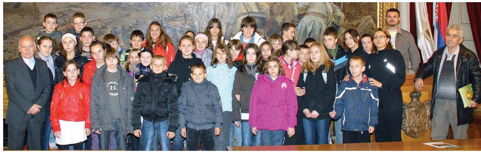
Заједнички снимак у Жупанији

ТРОДНЕВНА ПОСЕТА УЧЕНИКА СА КОСОВА И МЕТОХИЈЕ СОМБОРУ