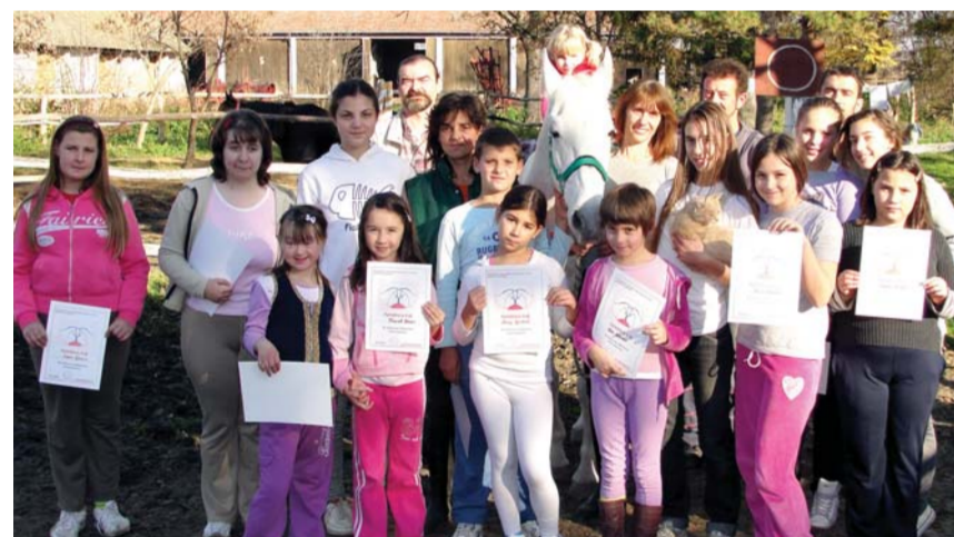
Дипломе за успешно савладану обуку