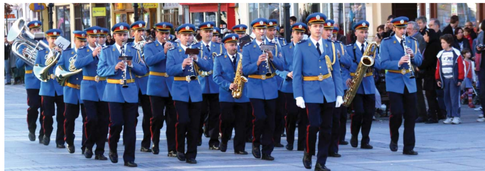
Оркестар Гарде Војске Србије