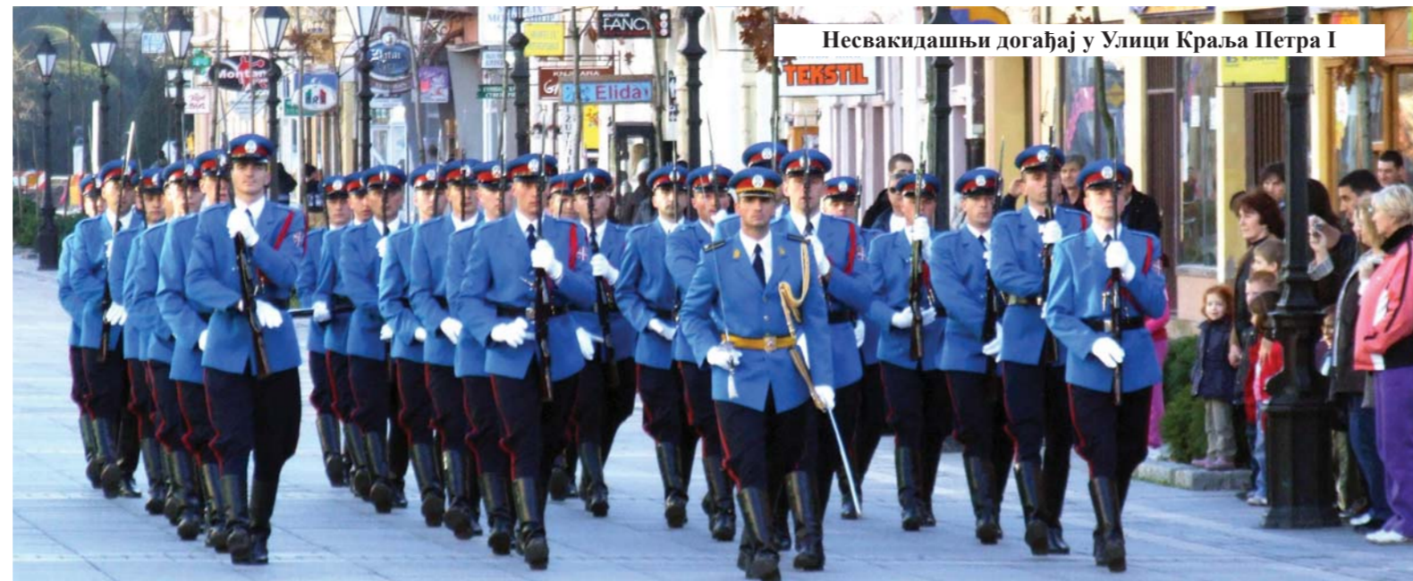
Несвакидашњи догађај у Улици Краља Петра I