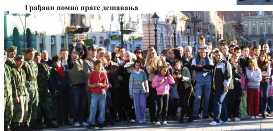
Грађани помно прате дешавања