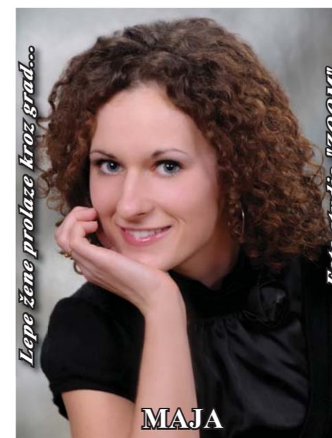
Lepe žene prolaze kroz grad...