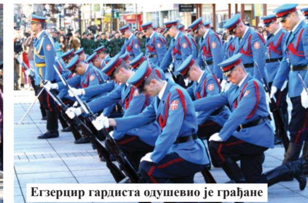
Егзерцир гардиста одушевио је грађане