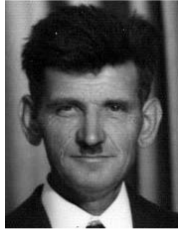
БОРБА ЈОСИЋА БУРЕ

Дана 04. 08. 2010. године навршава се пет година од смрти нашег оца, таста, деде, прадеде и пријатеља