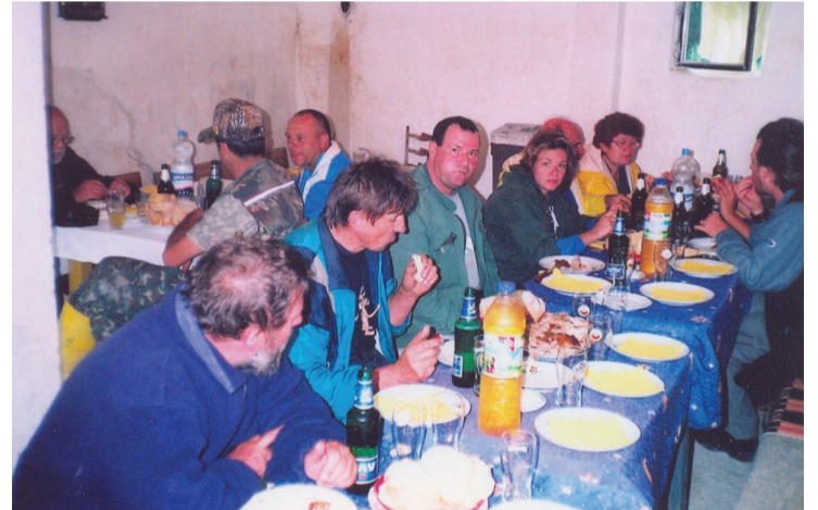
Oproštajna večera na Vagonima kod Apatina