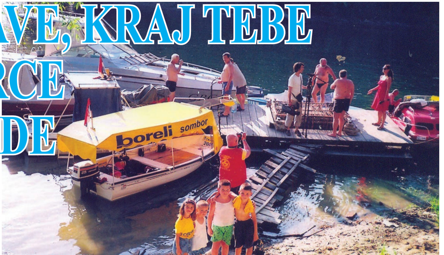
Uoči polaska iz Baračke

A učesnika odasvud. Uz najbrojnije Somborce i komšije Bezdanke, Monoštorce i ostale, tu je