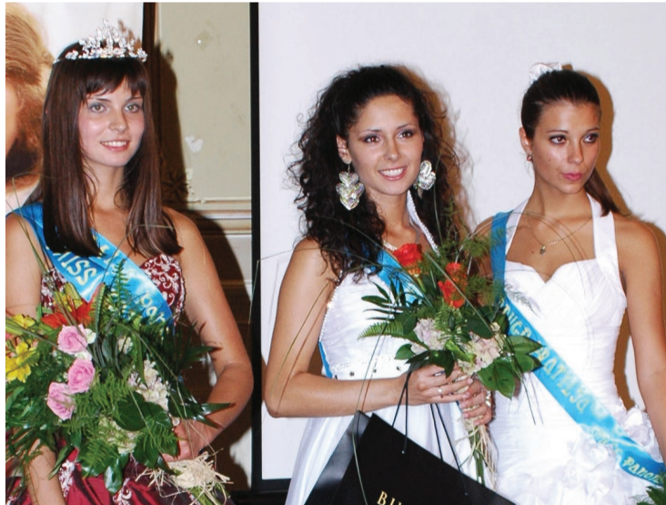
Misica i pratilje