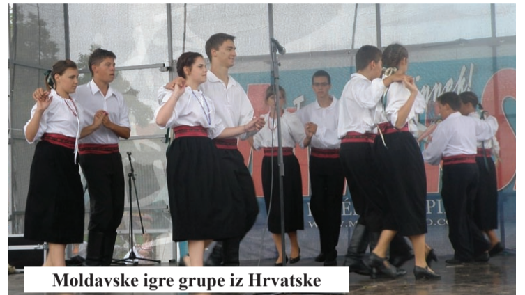
Moldavske igre grupe iz Hrvatske