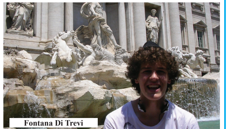
Fontana Di Trevi