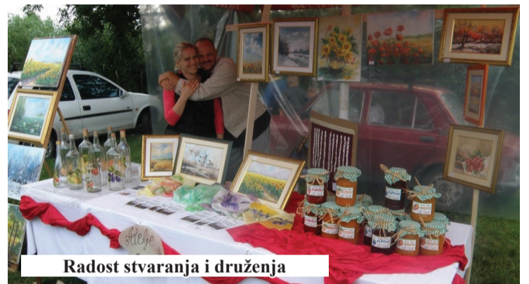
Radost stvaranja i druženja

ponudio šaroliku zabavu meštanima i gostima u zanimljivom ambijentu kraj kanalske obale.