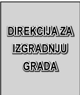
Direkcija za izgradnju grada

- To će biti rešeno završetkom izgradnje glavne ulice, odnosno nabavkom projektovanog urbanog mobilijara, u kojem je navedena pozicija „biciklarnici“. Oni će biti razmešteni duž glavne ulice. Javna nabavka za urbani mobilijar počinje ovih dana. Zasad se ne može tačno reći koliko parking mesta za bicikle će biti na glavnoj ulici, ali potrudimo se da ih bude dovoljno.