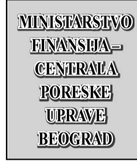
Ministarstvo finansija – Centrala Poreske uprave Beograd

- Bunar se redovno održava, a Zavod za javno zdravlje Sombor jednom nedeljno obavlja kontrolu vode, i ona je higijenski ispravna. „Vodokanal“ takođe vrši redovne interne kontrole. Međutim, zbog dotrajalosti bunara u Lugovu preduzete su određene mere da se problem vodosnabdevanja prevaziđe povezivanjem Lugova i Žarkovca na gradsku vodovodnu mrežu. Izrada projektne dokumentacije će biti okončana do kraja godine, a za početak naredne godine predviđeno je povezivanje Lugova na vodovodnu mrežu grada, čime će se stvoriti uslovi da se taj bunar izbaci iz upotrebe.