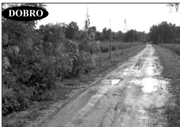
Zahvaljujući angažovanju vlasnika vikendica pokršena je ambrozija na ulazu u turističko naselje „Adica“ (Prilog čitaoca S.B.)

Javlajte nam se i dalje na telefone: 421-469 i 421-479 ili na e-mail adresu: so.somborske@neobee.net