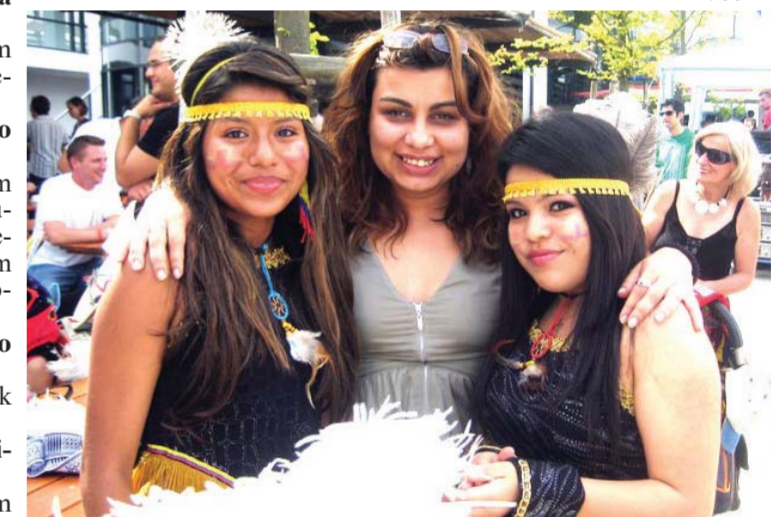
Maja sa indijankama