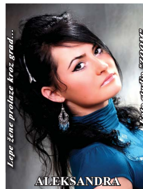
Lepe žene prolaze kroz grad...