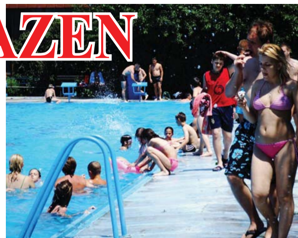
Gužva na Gradskom bazenu