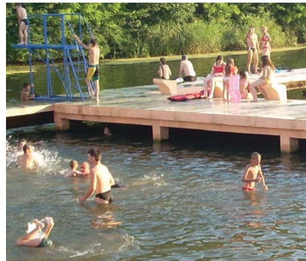
Gradsko kupalište „Štrand“