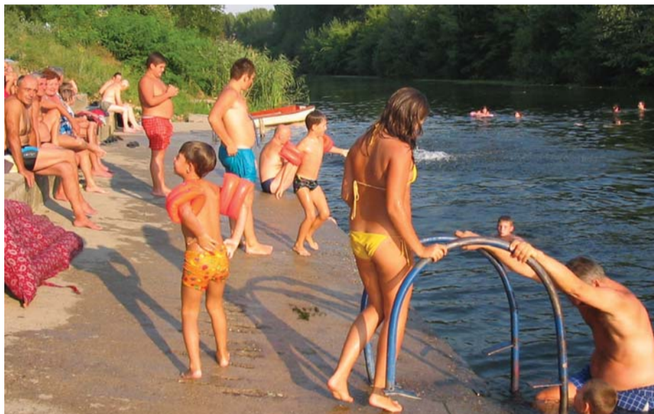
PIK-ovo kupalište, takođe omiljena destinacija...

O bezbednosti kupaca na bazenu i „Štrandu“ brine se spasilačka služba. Rade se i redovne analize vode za kupanje. Voda na „Štrandu“ je bakteriološki ispravna. Bez obzira na registrovano smanjenje kiseonika u vodi, kupanje na „Štrandu“ je dozvoljeno, a kupacima se po izlasku iz vode preporučuje tuširanje.