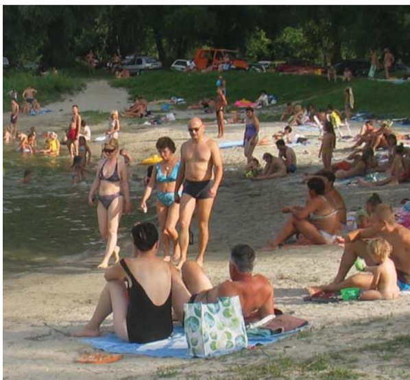
Kupalište kod „Plave ruže“ u Apatinu

- Na „Štrandu“ smo uradili kompletno sređivanje tribina, drvenarije i metalnih delova. Oplemenili smo sadržaje, sredili dečje igralište, sklonili sasušena drva i popravili par kabina. Na bazenu