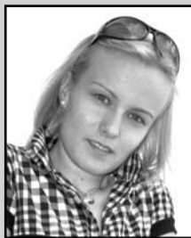
Piše: Tamara Stojković, novinarka "Somborskih novina"